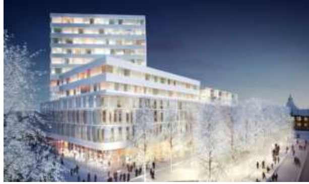
Illustration: White arkitekter