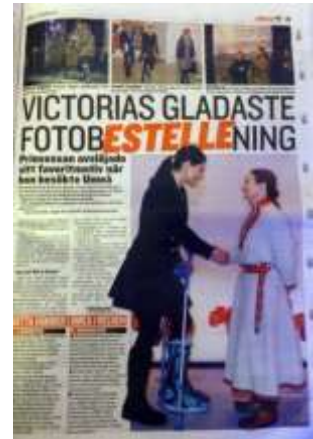
Kronprinsessan Victoria och Prins Daniel i 100 MIGRATORY.