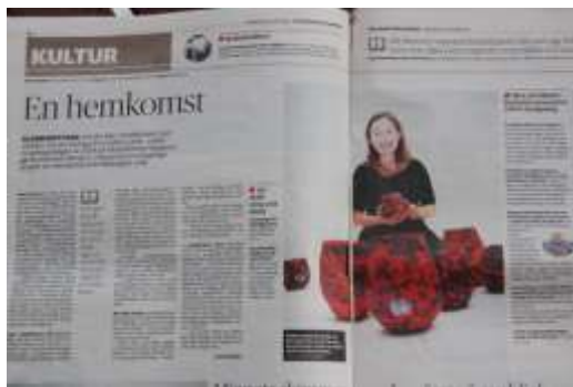
"En hemkomst" 24 januari 2014 i VK, Av Sara Meidell