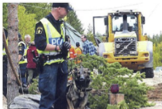
JOKKMOKK. Glaskärilet står där också, mitt i Kallak-striden förra sommaren.