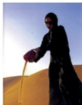
SAUDIARABIEN. Glaskärilet fyllt med ökensand.