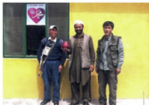
AFGHANISTAN. Tre män i Kabul, en automatkarbin och så glaskärilet från Uldevisfjällen.